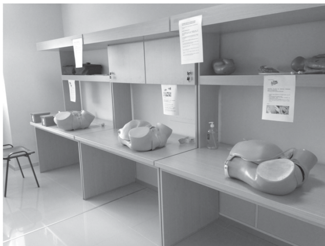
Figura 1. Laboratorio de aprendizaje

Para intentar solucionar éste problema, se ha incluido recientemente en la currícula de los Residentes de primer año de la Clínica Ginecología "A" de la Facultad de Medicina de Montevideo de la Universidad de la República Oriental del Uruguay (UDELAR) la experiencia en el Laboratorio de Aprendizaje. En él, se puede aprender y practicar distintas técnicas con objetos inanimados (simuladores-maniquís ginecológicos y obstétricos). Figura 1.