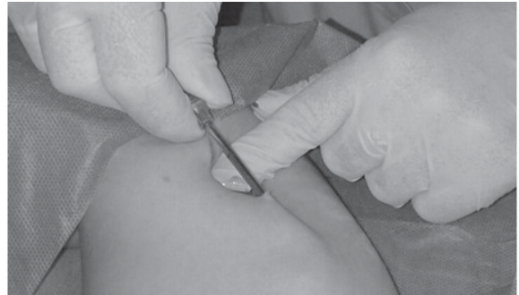
Figura 2. Colocación de implantes subdérmicos

Para la colocación de Implantes subdérmicos se utilizó simuladores inertes de polifón de miembro superior y se observó la colocación de los implantes in vivo a 3 mujeres, por parte del equipo docente. (Figura 2)