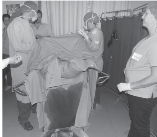
Figura 5. Simulación emergencias obstétricas. Hemorragia puerperal

la simulación de distocia de hombros se utilizó la participación de actores. Para la simulación de la eclampsia: participaron actores y set de módulos de dilatación y borramiento cervical. Para la simulación de la hemorragia puerperal se utilizaron actores reales, mediante la dramatización para el caso clínico, y simuladores en el examen físico (ZOE ® S 504.100). Figura 5.