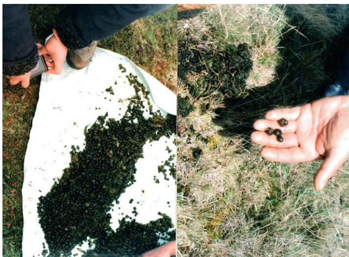
Figura 1. Recolección de Nostoc sphaericum en la laguna de Conococha, Huaraz, Perú

Se realizó un estudio analítico, experimental y longitudinal en el Centro de Investigación de Bioquímica y Nutrición (CIBN) de la Facultad de Medicina Humana de la Universidad de San Martín de Porres (FMH-USMP) y el Laboratorio de Farmacognosia de la Facultad de Farmacia y Bioquímica de la Universidad Nacional Mayor de San Marcos. El alga cianofícea Nostoc sphaericum fue colectada en la laguna Conococha en Chiquián (Huaraz) a 3400 m s. n. m. en el departamento de Ancash, Perú (Figura 1) y se depositó en el Museo de Historia Natural de la Universidad Nacional Mayor de San Marcos (Voucher USM 297250).